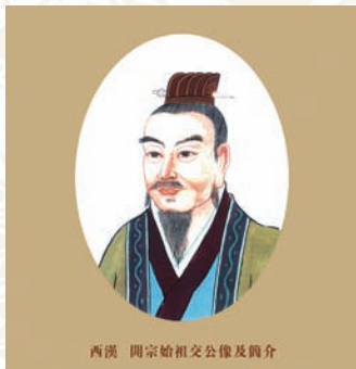
西汉 同宗始祖交公像及简介

刘交（？-公元前179年），字游，西汉沛人，为高祖刘邦同父异母兄弟。好读书，多才艺。受《诗》于荀卿门下浮伯丘。从刘邦起兵，入关中后封为文信君，曾随邦转战多地，战功赫赫。高祖即位，封为楚王。曾为《诗》传，称《元王诗》，卒谥元，俗称“楚元王”。