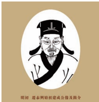
明初 迁泰兴始祖建成公像及简介