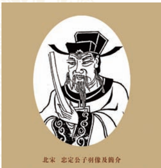
北宋 忠定公子羽像及简介